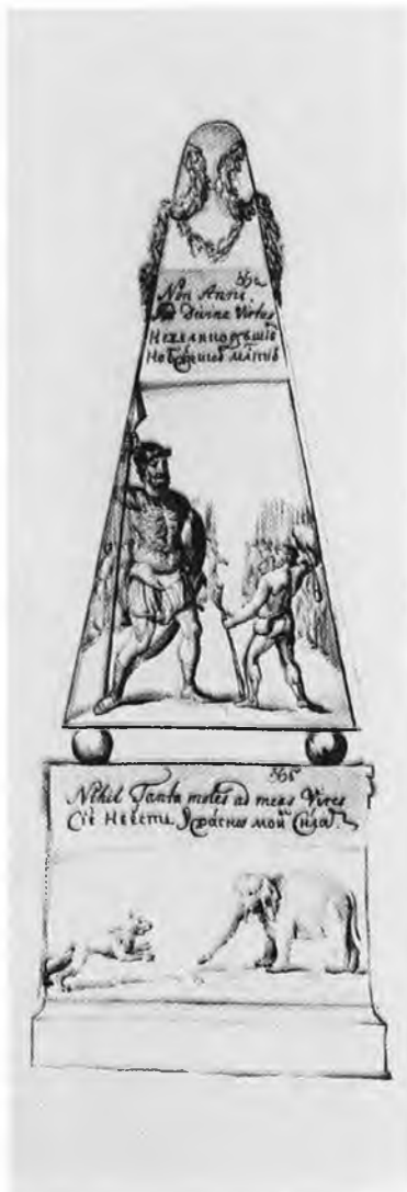
«Сие не есть ужасно моим силам»: император Петр II в образе Давида поражает Голиафа. Из символов и эмблем к коронации Петра II. 1727. Публикуется впервые.