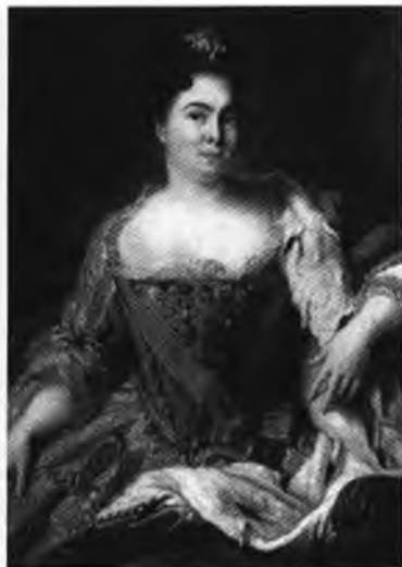
Екатерина I Алексеевна.