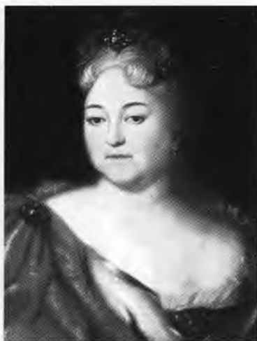
Цесаревна Наталья Алексеевна.

Червонец 1729 года с изображением императора Петра II.