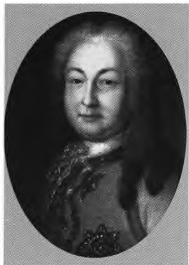
Граф Андрей Иванович Остерман.