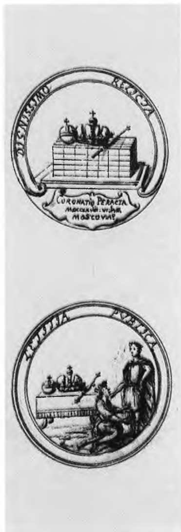
Проекты медалей к коронации Петра II. 1727. Публикуются впервые.