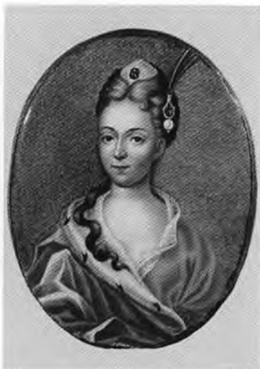
Принцесса Шарлотта Христина Софья.