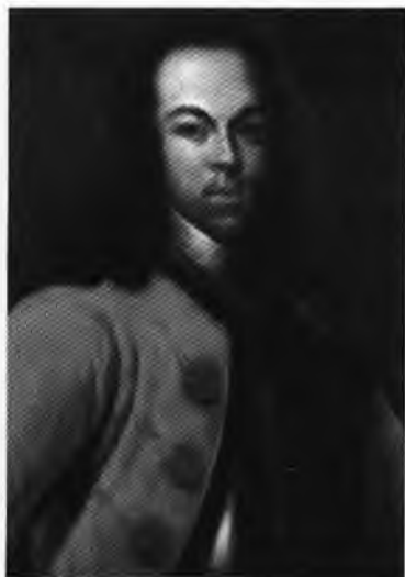
Царевич Алексей Петрович.