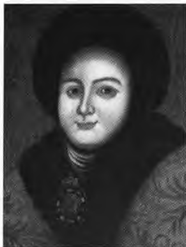
Царица-инокиня Евдокия Федоровна.

Кафтан и камзол императора Петра II. Франция. 1727—1730.