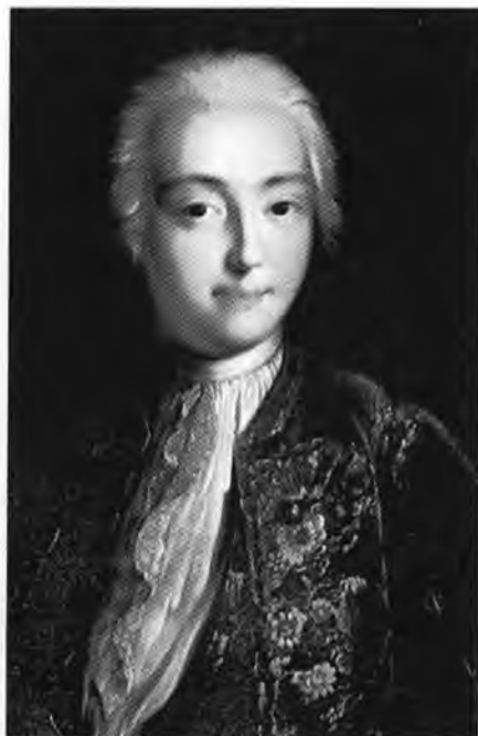
Цесаревна Елизавета Петровна.