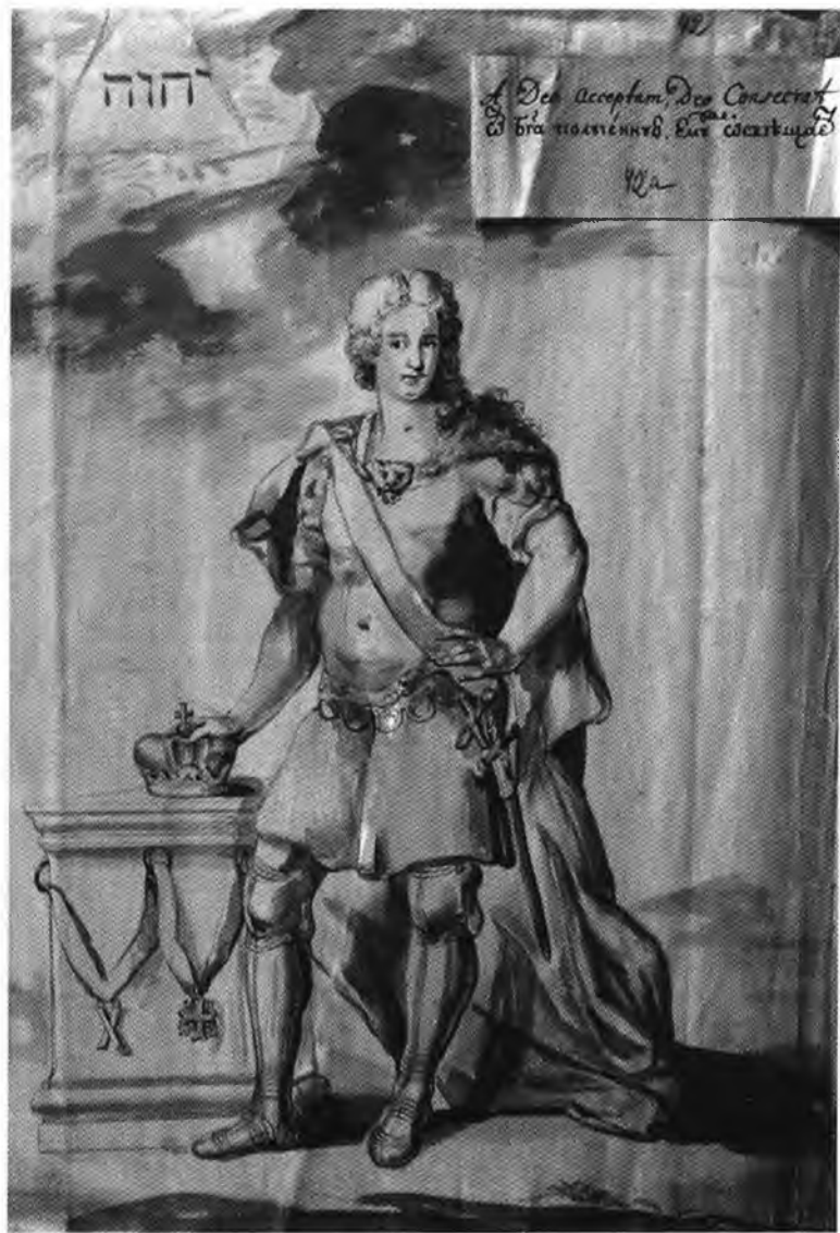
Император Петр II. Из подготовительных материалов к коронации Петра II. 1727. Публикуется впервые.