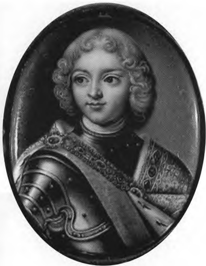
Петр II. Миниатюра А. Г. Овсова. Конец 1720-х гг.