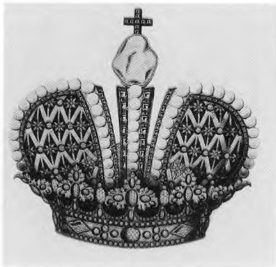
Рисунок императорской короны, подготовленный к коронации Петра II. 1727.