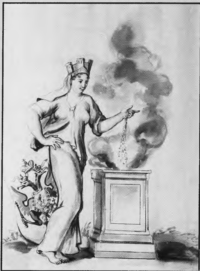
Символическое изображение России. Из символов и эмблем к коронации Петра II. 1727. Публикуется впервые.