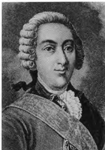
Князь Иван Алексеевич Долгорукий.