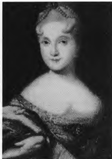
Княжна Екатерина Алексеевна Долгорукая.