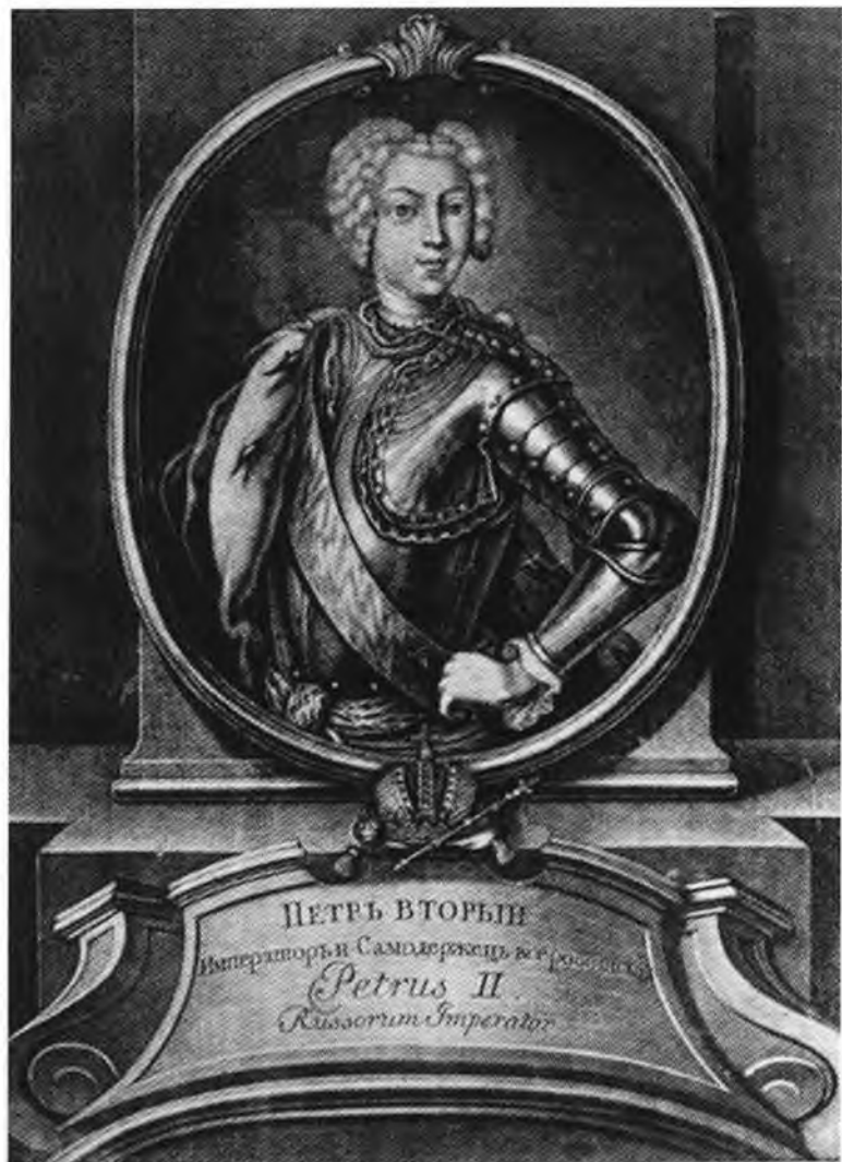
Петр II. С гравюры Вортмана.