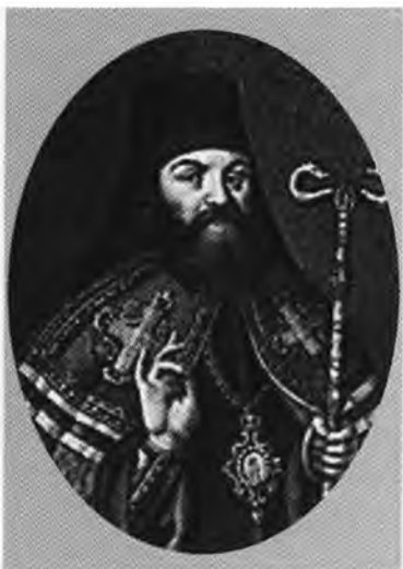
Феофан Прокопович, архиепископ Новгородский.

Проект иллюминации к коронации императора Петра II. 1727.