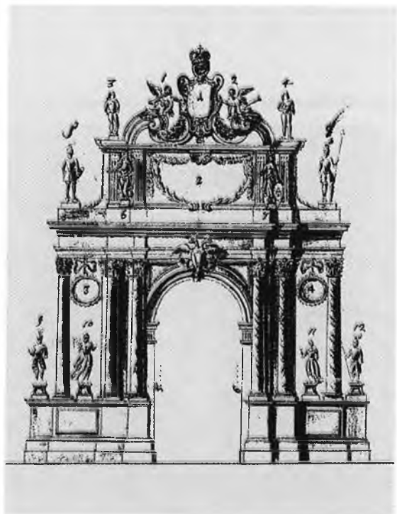
Проект Триумфальных ворот, подготовленный к коронации Петра II. 1727.