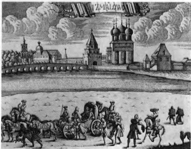
Измайлово. Выезд на охоту. Гравюра И. Ф. Зубова. 1726.