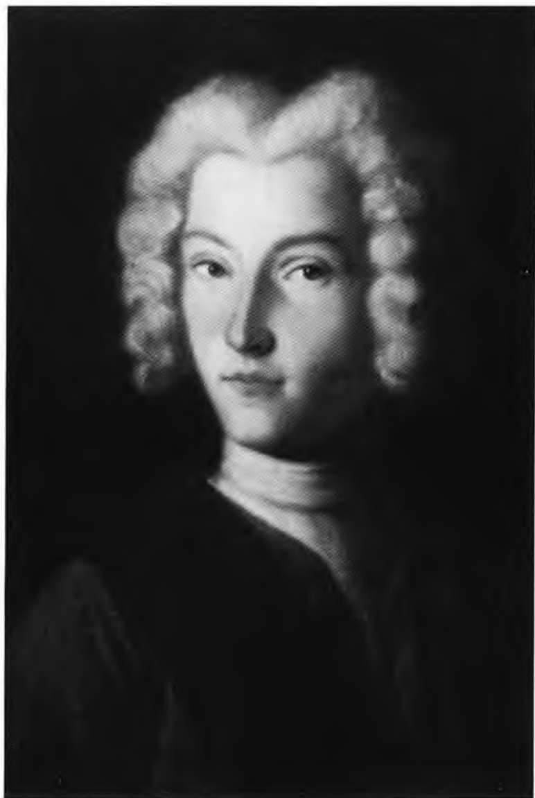
Петр II. Портрет Д. Г. Молчанова.